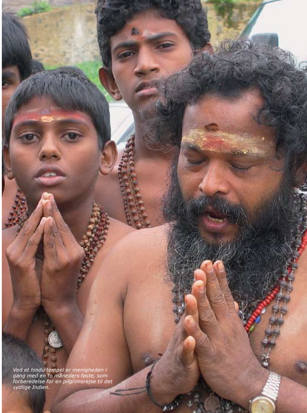
Ved et hindu tempel er menigheden i gang med en to måneders faste, som forberedelse for en pilgrimsrejse til det sydlige Indien.

Det havde været en indholdsrig togrejse, og da jeg et par dage efter skulle videre til den modsatte ende af højlandet, gik jeg direkte ind i restaurationsvognen og fik plads på grydekassen.